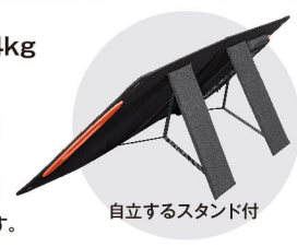
自立するスタンド付