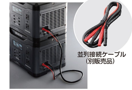
並列接続ケーブル(別販売品)

並列接続ケーブル(別販売品)で2台のポータブル電源を接続、同時に稼働させることにより、出力電力・電池容量がアップします。